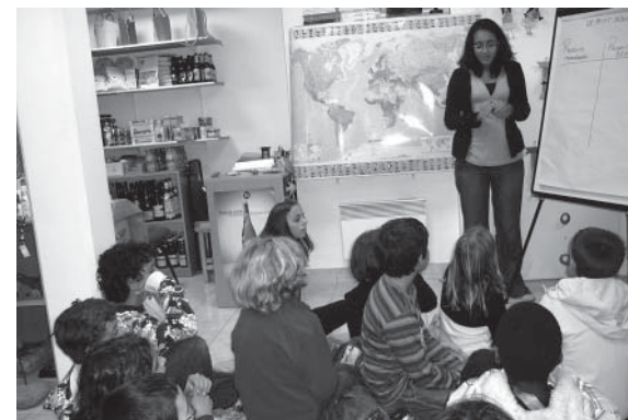
Ateliers scolaires de Terroirs du Monde.

« Va raconter ça à quelqu'un qui n'en a jamais entendu parler! »