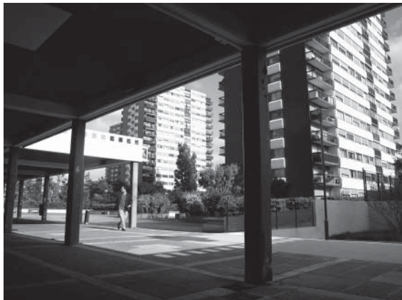
Vue de l'intérieur du centre commercial des Larris.