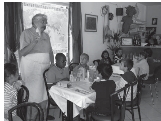
Après-midi dégustation pour les enfants.

Il y a aussi de bonnes relations avec "Larris au cœur" (ancien centre social), dont les bénévoles ont repris les locaux et dont la présidente fait partie d'Equitess. Il y a le public et le lieu. Certains membres d'Equitess font partie d'autres collectifs, comme celui qui organise la fête de la musique.