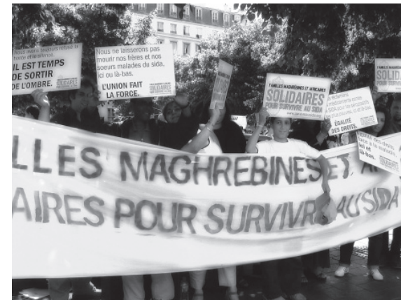
Rassemblement de 2002 L'union fait la force!

L e Comité des Familles est une association créée par et pour des personnes concernées par le VIH, leur famille et ceux qui les aiment, pour lutter ensemble, vivre et se soigner dans la dignité. C'est un réseau d'information, de rencontres, d'entraide et qui milite pour l'égalité des droits face à la maladie.