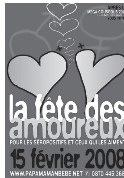
Affiche de la fête dans le local

«Ce n'est pas très grand, mais pour une fête, en se servant, on peut tenir à 80. On a prévenu les voisins pour la soirée Halloween. Les enfants sont allés chercher des bonbons...»