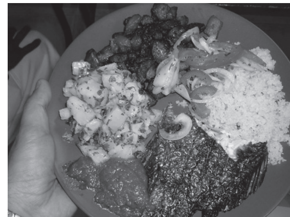
Une belle assiette ivoirienne à l'hôpital!

Au fil des ans, ce "Projet Chorba" s'est développé, pour devenir depuis 2007 un repas régulier avec des personnes séropositives hospitalisées en banlieue, chaque lundi pendant le mois du ramadan et une fois par mois tout le reste de l'année. Il ne s'agit pas d'un projet caritatif, car les patients mangent déjà, mais il est important parce que bien manger est la première forme de thérapie. Un souper différent de leur alimentation habituelle (diététique et peu savoureuse) et «préparé avec le cœur.»