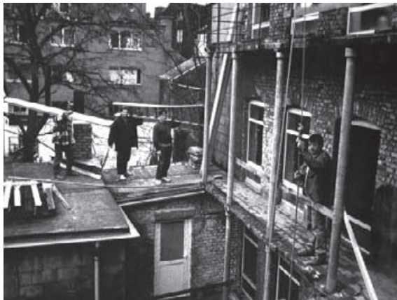
Les "Sans-abri castor" en action.

Les projets d'auto-construction sont souvent assimilés, par les autorités, à du travail au noir, et vues comme des pratiques ne respectant pas certaines normes de construction. Et voilà les projets abandonnés ou même étouffés dans l'œuf. Alors, comment peut-on faire pour que l'arsenal administratif ne bloque pas a priori toutes ces initiatives? Faut-il travailler à faire évoluer le cadre législatif?