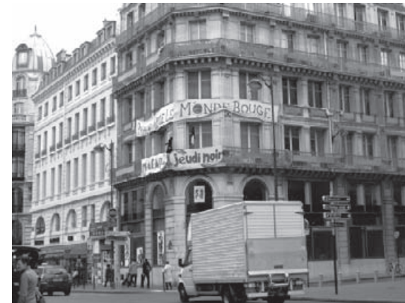
Occupation "Ministère du Droit au Logement" Paris 2007.

Plusieurs groupes ont présenté les actions qu'ils mènent dans le domaine du logement. Vu la nature du problème, la mobilisation collective des participants au réseau vise principalement l'interpellation des autorités politiques pour les confronter aux problèmes de logements. Elles tentent aussi de sensibiliser l'opinion publique.