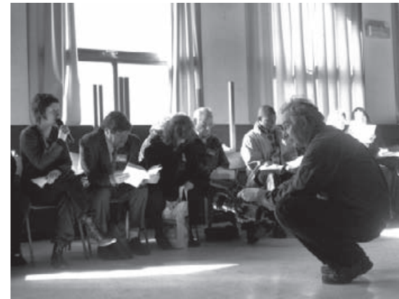
La rencontre de Tournai

C'est au Foyer Saint Brice de Tournai que le collectif Droit Au Logement avait donné rendez-vous le 2 mars dernier aux groupes intéressés par la thématique du logement. Celle-ci était apparue comme un sujet à approfondir lors de notre dernière rencontre plénière à Mons. En effet, 12 groupes et plus de soixante personnes sont venues échanger leurs pratiques, questions et espoirs.