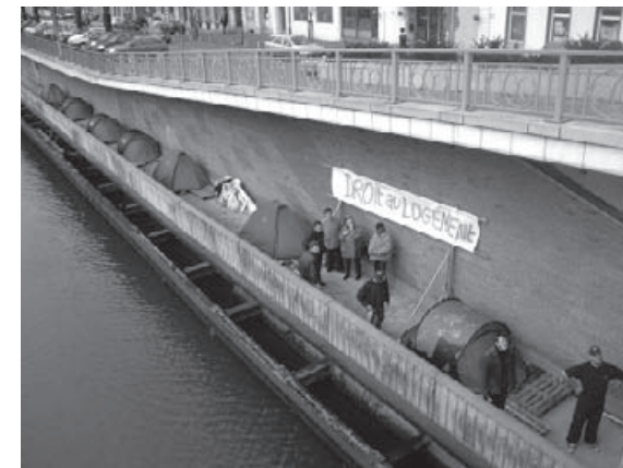
Les tentes le long de la Sambre à Charleroi.

Le 17 janvier 2007, en soutien avec les Enfants de Don Quichotte du canal Saint Martin à Paris, et sous l'impulsion de l'association Solidarités Nouvelles, des militants, citoyens, sans abris, travailleurs... ont planté des tentes le long de la Sambre à Charleroi.