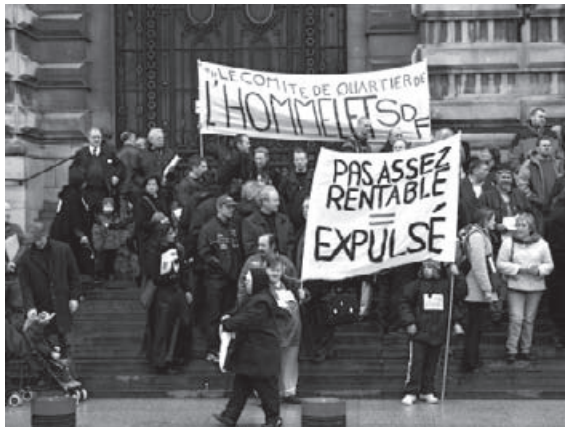
Lutte contre l'expulsion du Comité de Quartier à l'Hommelet.