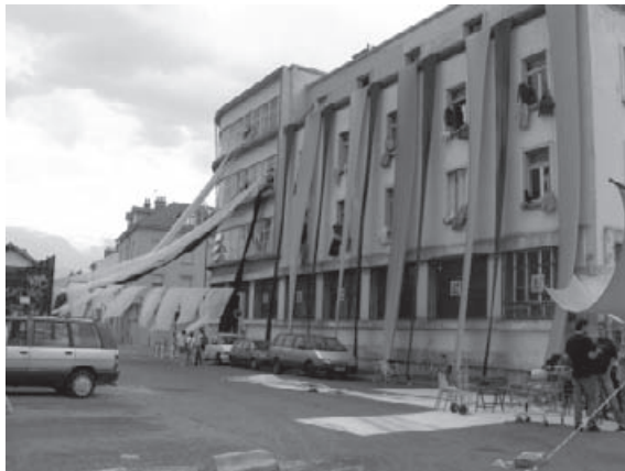
Fête pour les onze ans du squat "Le Brise Glace", Grenoble?

Plus d'informations sur les expériences de squats politiques en Europe, www.squat.net/fr