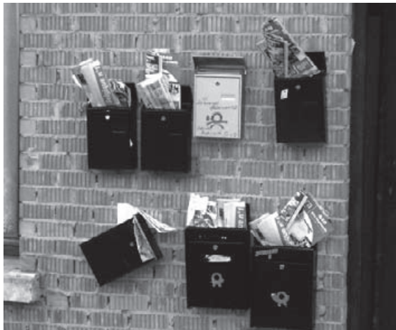
Les boîtes aux lettres à Fontaine l'Évêque.

Voir le site: www.moc-ct.be , rubrique "Actions"