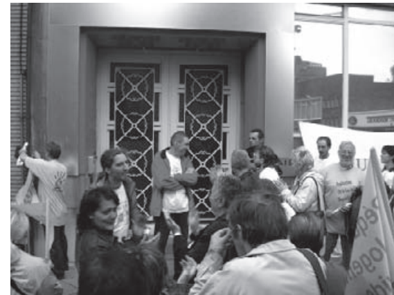
Revendication: Charleroi zone "EXPULSION zéro".

A partir d'une réflexion collective sur la "sécurité chez soi" menée par les groupes "Action Contre la Précarité", il a été montré que les problèmes liés au logement et identifiés comme étant les plus criants dans la région de Charleroi sont dus à ce qu'ils appellent la "mafia du logement". Il s'agit de propriétaires sans scrupule qui, parfois entourés de groupes armés, mènent des expulsions sauvages des locataires de leurs immeubles. Toutes ces expulsions sont illégales.