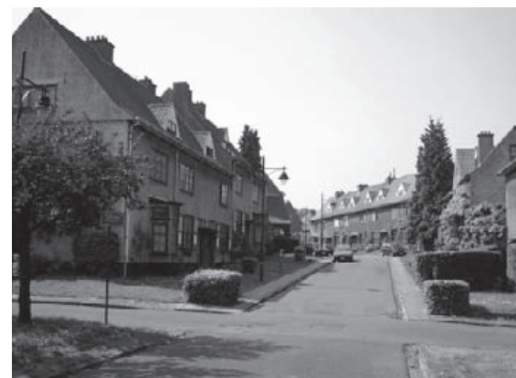
La Cité Jardin “Le Logis” en région bruxelloise

“ Les Castors ” est un mouvement très répandu dans les années 50, qui visait à permettre à des personnes n'ayant que leur salaire pour capital de construire leur propre maison pendant les week-end. Certains ont donc monté des programmes de Cités Castors, coopératives avec parfois tirage au sort des maisons une fois construites, d'autres ensuite recevaient des plans pour “construire sa maison soi-même”.