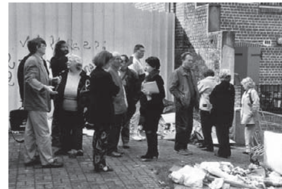
Le "diagnostic marchant" de Paroles d'Habitants.

Le problème de la qualité des logements est posé par EN.CO.RE, qui raconte combien le Valenciennois est touché par des situations de logement indigne et insalubre.