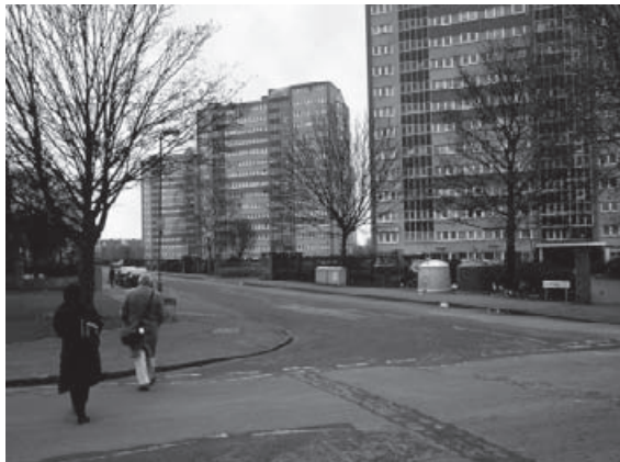
La ZUP de Birmingham.

Cette expérience sans précédent en Angleterre a fait changer la législation puisque, grâce à cette initiative, une association peut, sous certaines conditions, réclamer la gestion des logements publics dans sa ville depuis 1993.