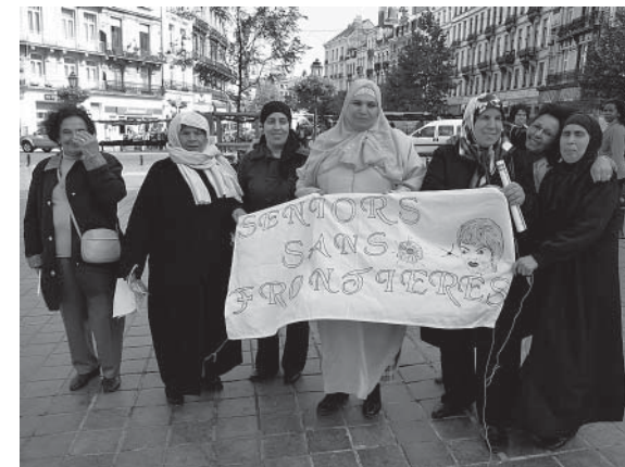
Krachten bundelen voor het recht op erkenning

A ls je de relatie met de buitenwereld aankaart, de openstelling van de groep of de link met de instellingen, dan komen de banden met het land van oorsprong als het ware spontaan tevoorschijn. Het gaat hier om een complexe relatie tussen twee nationaliteiten die sterk verankerd zijn en toch beide onvolledig zijn.